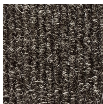
102 - Zwart