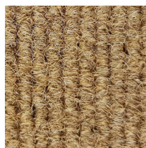
107 - Coco

Nota: De vermelde specificaties, omschrijvingen en illustraties zijn gebaseerd op de beschikbare informatie op het ogenblik dat deze publicatie gedrukt werd. Inkommaten en inkommatkaders met uitsnijdingen en/of onregelmatige vorm, prijzen en leveringstermijn steeds op aanvraag.