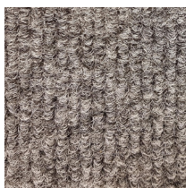
101 - Grijs